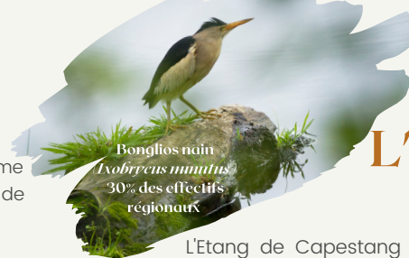
Bonglios nain Ixobrychus exilis 30% des effectifs régionaux