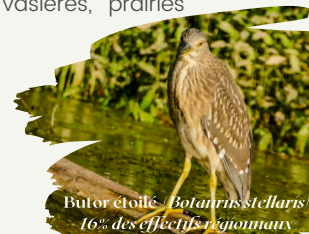
Butor étoilé - Botaurus stellaris 16% des effectifs régionaux