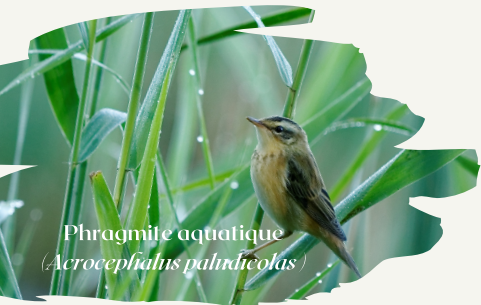
Phragmite aquatique ( Acrocephalus paludicola )