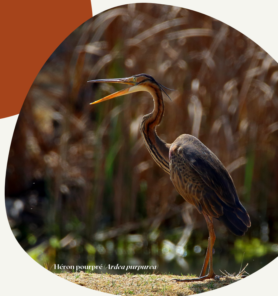
Héron pourpré ( Ardea purpurea )

Site de Toulouse 17, av Jean Gonord CS 85861 31506 TOULOUSE CEDEX 5