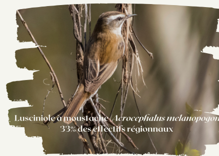
Lusciniole à moustache - Acrocephalus melanopogon 33% des effectifs régionaux

Le maintien de ces activités humaines, qui ont permis à ce site d'être une des zones humides les plus riches de la région, constitue un pivot essentiel de la gestion patrimoniale du site.